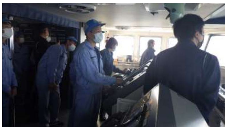
「ハードスターボード」：右に35度