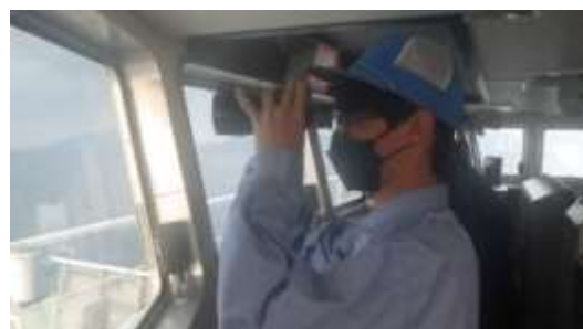
「11時方向、8マイル先大型船です！」