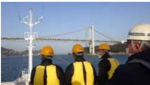
2回目の関門海峡は視界良好！