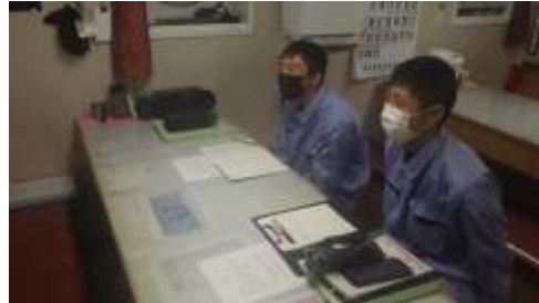
船員法や船内組織を勉強中！