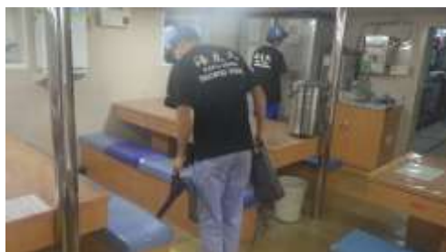
食後は清掃・消毒