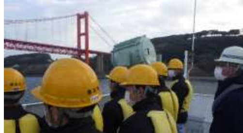
平戸瀬戸（峡水道）見学中！