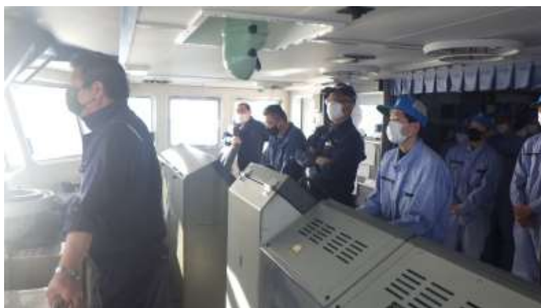
「ポート10」：左に10度舵を切る