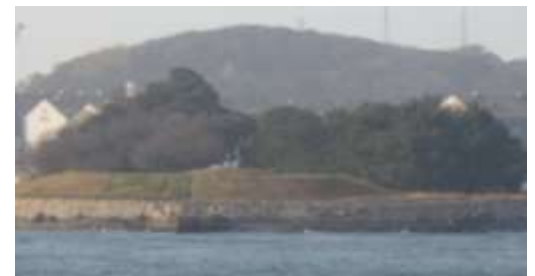
「アントニオ猪木 v s マサ斎藤」決戦の地 または、「宮本武蔵 v s 佐々木小次郎」