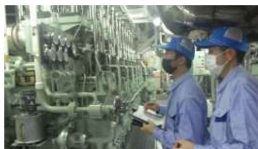
「主機関、各圧力正常！」

夜中の当直は、四国沖を航行。当然、夜間の航行は視界が悪く、少し揺れもあったので、0-4や4-8当直に入った本科生3名は、見事全滅！全員トイレと仲良くなりました（笑）・・・「頑張れ！これも試練だ。」