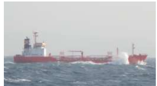
他船も航行に注意している様子

昼前から風が強くなり、昼食を食べない生徒もいましたが、無事に関門海峡を抜け、部埼沖で錨泊する頃には落ち着き、皆夕食を食べています。明日は、海友丸を実際に操船する「操舵実習」が始まります。前回の操舵号令の反省を生かし、正しいコースを全員保つことができるのでしょうか？・・・頼むから反対に舵は切らないでね（笑）