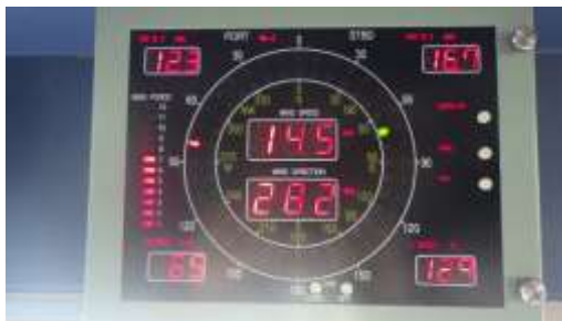
風力階級は7（平均風速14.5m）