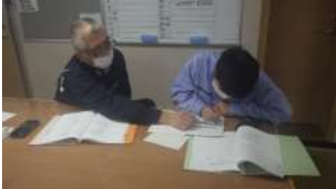
航海の計算は難しい！