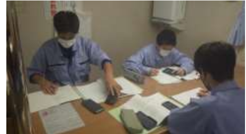
提出期限に間に合うのか？