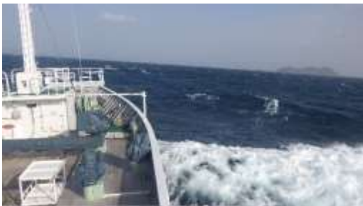
海上風警報発令中！