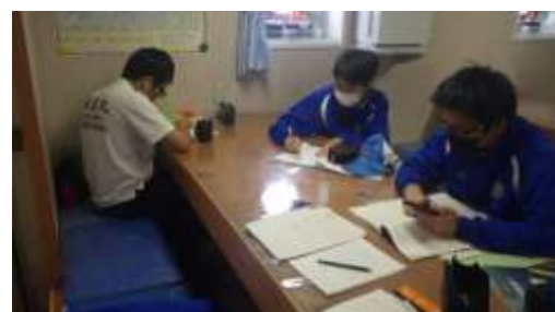
空いた時間に専攻科生と自習